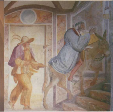
Holzvertäfelte Söllerstube (li. oben); Innerer Burghof (re. oben); Alte Dürnitz (li. unten); Narrentreppe (re. unten und Titel)

der nahezu intakte Befestigungsring mit seinen Wehrtürmen, Torbauten und Teilen des alten Wehrgangs sowie der hoch aufragende Bergfried, genannt der Wittelsbacher Turm. Der prächtige Innenhof mit seinen Laubengängen versetzt den Besucher dagegen in die Zeit der Renaissance.