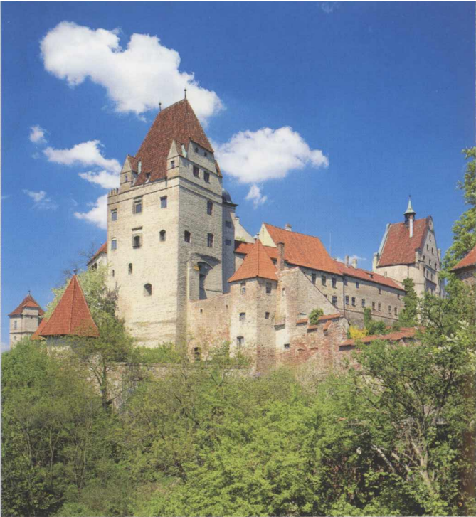
Burg Trausnitz von Südwesten, im Vordergrund der Wittelsbacher Turm