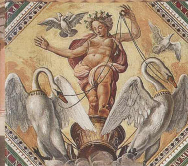
Italienischer Saal (li. oben); Audienzzimmer der Birkenfeldzimmer (re. oben); Detail Deckengemälde von Hermanus Posthumus im Venuszimmer (li. unten); Arkadengang im Innenhof (re. unten)

Im Inneren wurden die hohen Gewölbesäle durch italienische Stuckateure ausgestaltet und durch die Maler Hermanus Posthumus, Hans Bocksberger d. Ä. und Ludwig Refinger mit bedeutenden Bilderzyklen zu biblischen, mythologischen und historischen Themen ausgemalt. 1543 war die gesamte Anlage fertig gestellt.