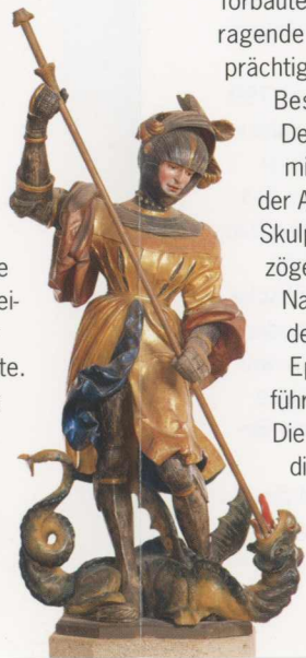
Die Figur des hl. Georg von Stephan Rottaler, um 1520, aus der Burgkapelle

Die mächtige Burg Trausnitz, die auf einer Anhöhe die Stadt Landshut überragt, wurde 1204 durch Herzog Ludwig I., den Kelheimer, gegründet. Ein Vierteljahrtausend bildete diese Stammburg der Wittelsbacher Residenz und Regierungssitz der niederbayerischen Herzöge. Insbesondere waren es die »Reichen Herzöge« von Bayern-Landshut, Heinrich, Ludwig und Georg, die im 15. Jahrhundert die Geschicke der Burg bestimmten. Noch heute wird im Vierjähresturnus die »Landshuter Hochzeit« gefeiert, die Ludwig der Reiche zur Vermählung seines Sohnes Georg mit der polnischen Königstochter Hedwig 1475 ausrichtete. Im 16. Jahrhundert erfuhr die Burg als Hofhaltung der bayerischen Erbprinzen nochmals bedeutende Ausbauten, die ihr in Teilen das Gepräge eines Renaissanceschlusses gaben. So kennzeichnen das Äußere der Burg Trausnitz heute zum einen ihre mittelalterlichen Bauten wie