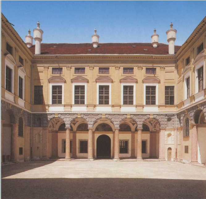
Innenhof der Stadtresidenz nach Westen